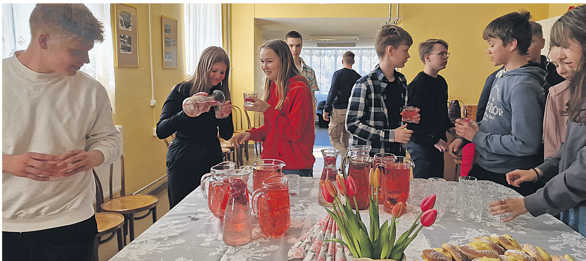
Peräst päämurdmist uut nuuri nuputejit Riidaja kultuurimajan tore morsilaud, mille pääl ollive kah Mulgi korbi.