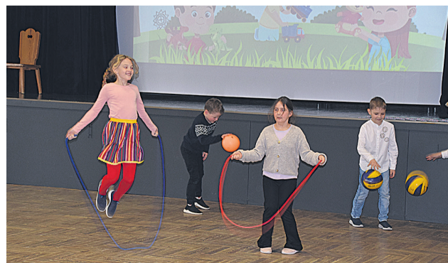
Kuigi nüidse aa latse mängive pallu arvuti- ja telefonimänge, näidässive na perimuspäeväl, et mõistave iki palli mängi, üppenöörige karate ja ütüstöist taga aade kah.