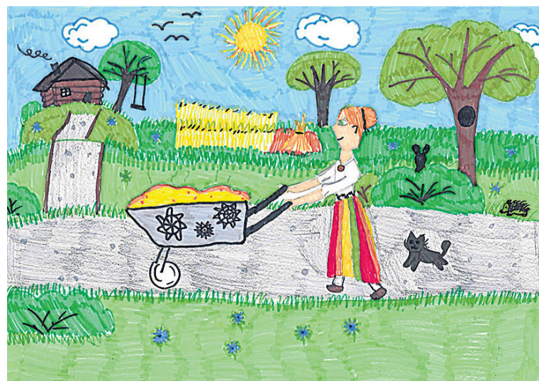
Ummuli põhikooli tüdruku Sisaski Aneti pilt “Kärutädi puder” olli kigin indajide lemmik.