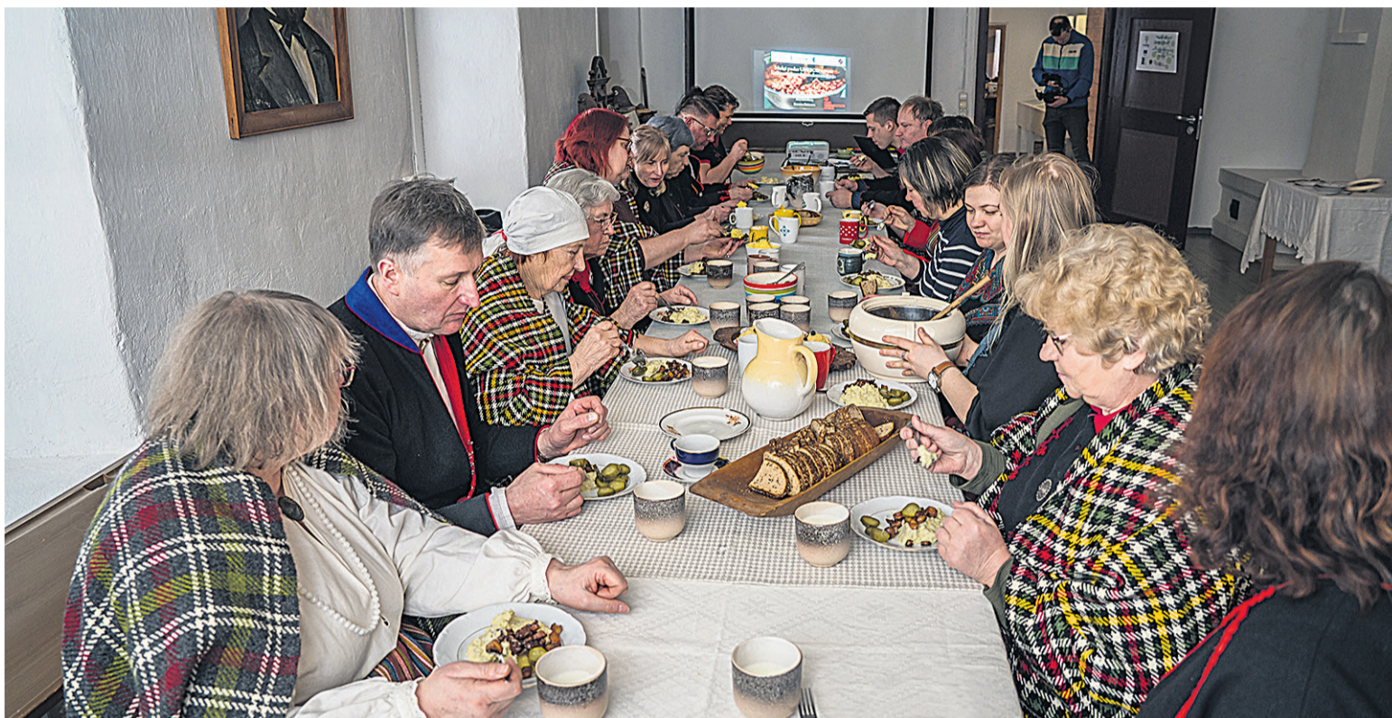
Ku mulgi kokku tuleve, piap laud iki loogan oleme. Iki levváp säält vanu äid süüke, a pallu uut ja põnev et kah. Pilt om tettu ERMi Eimtal muuseumin.

Aaste sissi mahup kirivene kava, kust levváp nii ulka Mulgimaal joba täädä-tuntu ettevõtmisi ku peris uusi sündmisi. Sihk om jagade Mulgimaa süüki ja söögikombit suure ulga oma kandi rahva ja külalistege.