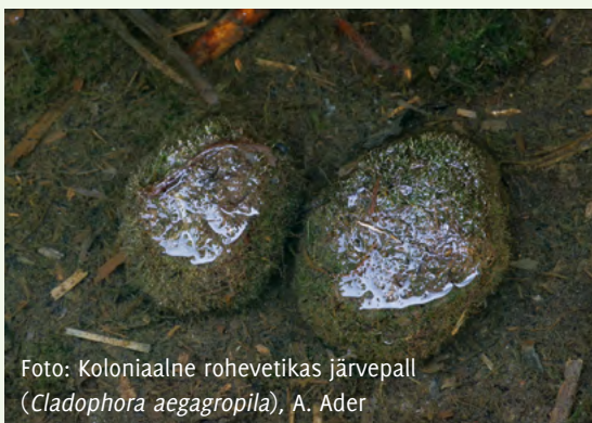
Koloniaalne rohevetikas järvepall ( Cladophora aegagropila )

Matkarada kulgeb ühes osas ürgoru nõlval, kust avanevad vaated Vidva ojale, teine osa rajast läbitakse metsasemal madalamal tasapinnal piki Vidva oja vastaskallast, võimaldades vaatekohtadelt imetleda nõlvadel avanevate liivakivipaljandite võimsaid seinu. Õisu jõeorgu kutsutakse ka Mulgimaa Taevaskojaks .